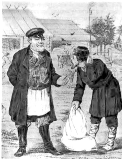
Зажиточный и бедный крестьяне

Город Рыбинск- ближайший сосед Мышкина. Большой торговый город. Недаром в стародавние времена его называли-Хлебной столицей России. Отличное расположение города на слиянии Волги и Шексны давали ему большое преимущество в накоплении товаров для отправки по Мариинской водной системе, огромных партий хлеба в столицы России, прежде всего в Петербург. Многие мышкинские купцы занимались таковым промыслом и с Рыбинском имели теснейшие связи, и не только коммерческие, но и родственные: не одна мышкинская купеческая семья породнилась с купеческой семьёй рыбинской. Но мы в данный момент не об этом. В Ярославских губернских газетах того, дореволюционного времени, очень много давалось материалов из Рыбинска. Сведения самые разные: и о состоянии рыбинской хлебной биржи, и об отправке торговых судов с хлебом, ну и конечно, о разных рыбинских местных событиях. Вот и нам в последнем 374 номере от 31-го декабря 1899 года в газете «Северный край» встретилась очередная зарисовка рыбинского автора, который очень много публиковался в ярославских газетах того времени. Автор печатался под псевдонимом «Оса». Его зачастую очень яркие и критические заметки доносили до читателя сведения о многих язвах российского капиталистического общества. Ну и конечно, юмор не был в загоне у этого очень яркого и плодовитого автора. И мы предлагаем нашим читателям небольшой фрагмент этого автора из рубрики «Письма из Рыбинска».