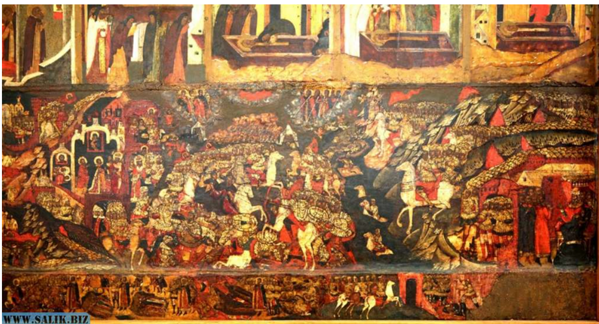
Правая часть фризa иконы

Влево разворачиваются сцены погребения павших в битве воинов и изображается войско, возвращающееся в Москву через Коломну. Фактическое разделение двух враждебных Руси сил: рязано-литовской коалиции, с одной стороны, и войска Мамаю – с другой, подчеркнуто художником размещением их в правом и левом краях основного