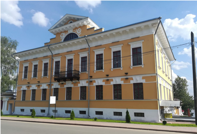
Здание Опочининской библиотеки (бывший главный дом усадьбы купца Т.В.Чистова XIX век). г.Мышкин.

ные целеустремленные труды по преобразованию Вятского. Пример этот до сих пор остается в России среди очень малого числа подобных добрых случаев. Весьма большой редкостью является факт, когда крупный предприниматель принимает на себя громадную заботу об одном конкретном провинциальном местечке. Дело в равной мере свидетельствует и о большом благородстве поступков и о высокой цивилизованности личности.