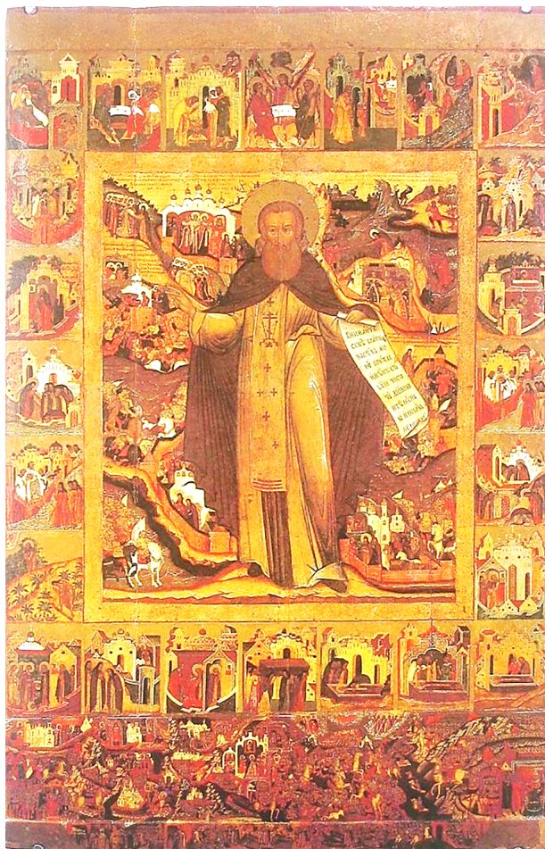
Сергий Радонежский в житии. Икона XVII века.

В Москве, в Государственном музее Рерихов есть картина «Ярославль. Церковь святого Власия. 1903 год», изображающая не существующий ныне каменный храм, располагавшийся слева от площади Волкова (тогда Театральной). Именно для Троицкой церкви, известной под названием «Власьевская», ещё деревянной погибшей в пожаре 1658 года и восстановленной в камне на этом же месте, была написана икона «Сергий Радонежский с житием». Специалисты считают, что это было в конце 40-х – начале 50-х годов XVII века. «Около 1680 года к этой иконе была нарощена доска с изображением