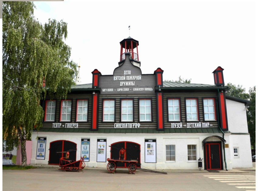
Музей «Детский мир» (здание пожарного депо). с. Вятское.