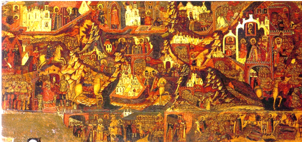
Левая часть фризa иконы

2021 фриза. Этим художник отмечает не только их территориальную и военную, но и политическую изолированность. Большое значение художник придает масштабному соотношению отдельных частей композиции.